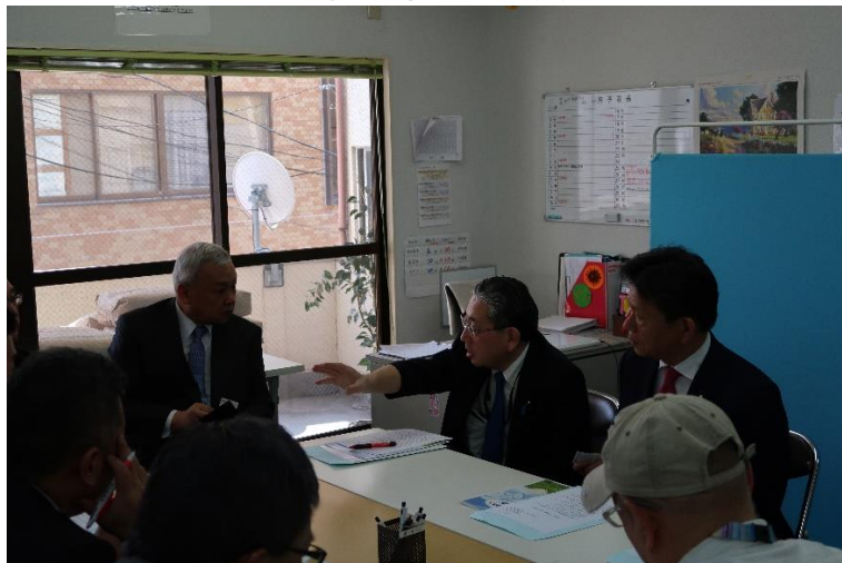
ヒアリング状況②（事業所内にて）