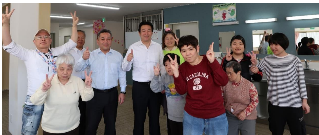
④事業所2階にて、秋元議員・青山議員・女性利用者と撮影

※法人より、県の立入調査が原因でスーツ姿の男性を見かけると怯える女性利用者がいるとの申し出を受けたため、各議員はジャケット等を脱いで視察を実施した。