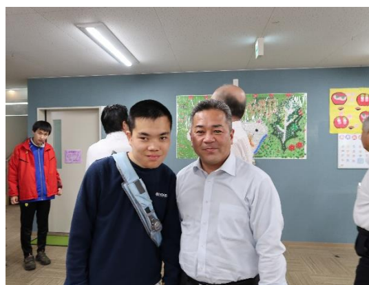
③青山議員・男性利用者と撮影