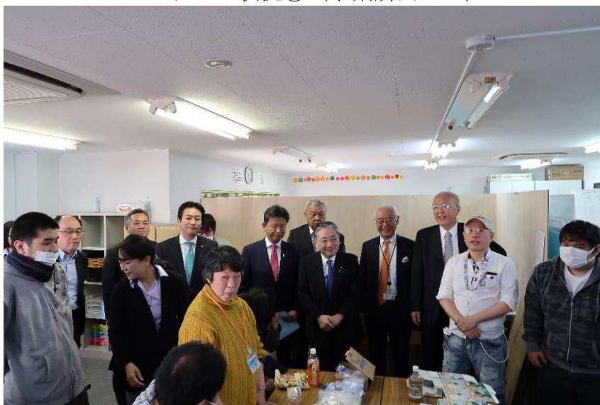
（就労移行支援を利用する障がい者の方々と共に撮影）