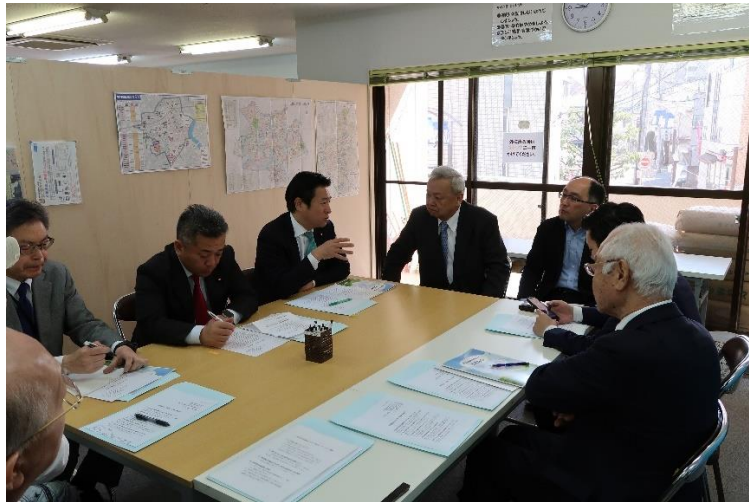
ヒアリング状況①（事業所内にて）